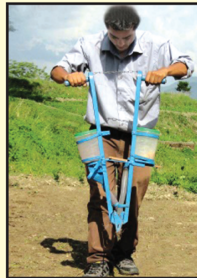
चित्र २ : जेव प्लान्टर