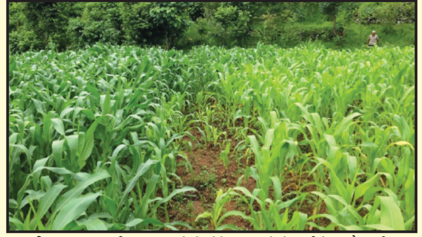
चित्र ४ : रासायनिक मल राखेको (देब्रे) र नराखेको (दाहिने) मकै बाली