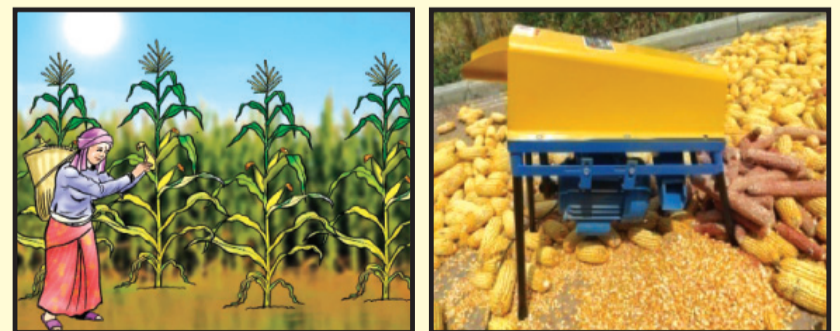
चित्र १३ : मकै टिप्ने (भाँच्ने) सही समय