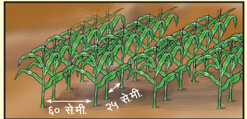
चित्र १ : लाईन देखि लाईन र बोट देखि बोटको दुरी मिलाइएको मकै खेती