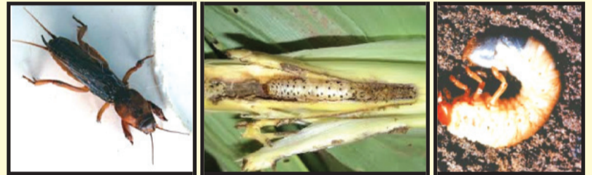
चित्र ६ : किर्थो कीरा