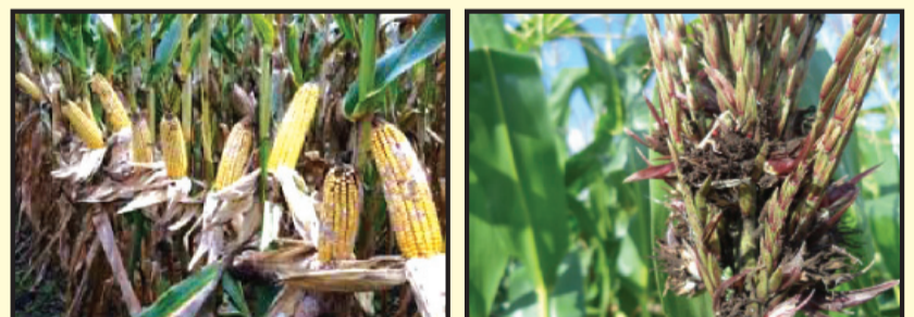
चित्र ११ : घोगा कुहिने रोग