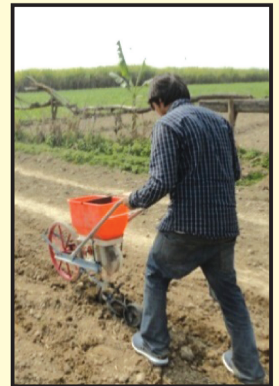
चित्र ३ : हाते मेशिन