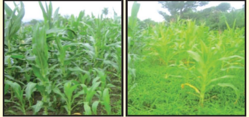
चित्र ५ : व्यवस्थित मकै खेती (देब्रे) र अव्यवस्थित मकै खेती (दाहिने)